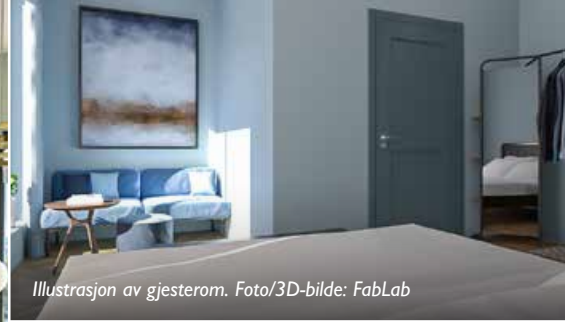
Illustrasjon av gjesterom.