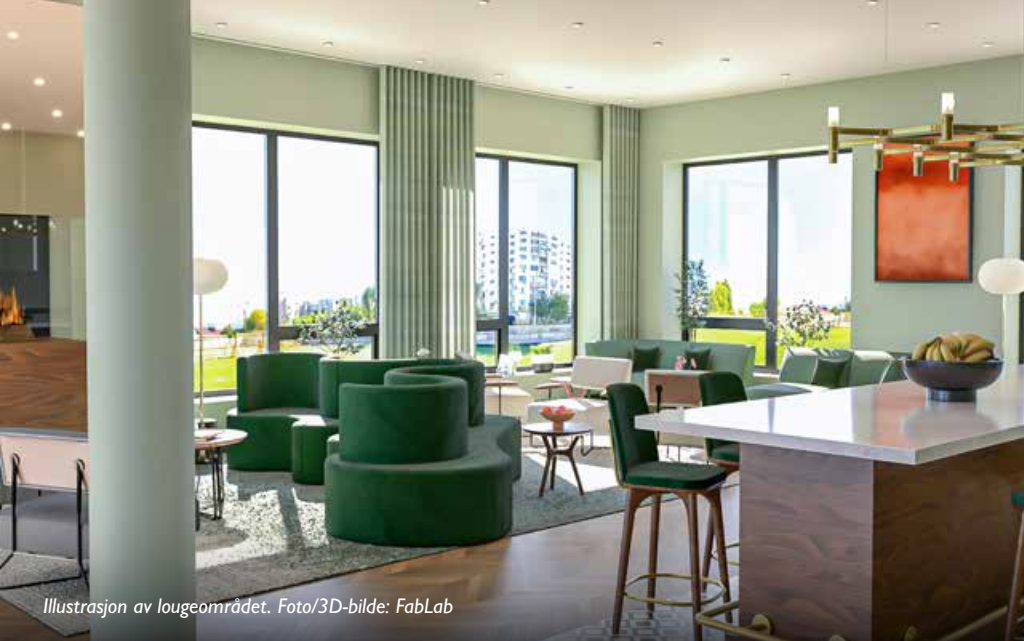
Illustrasjon av loungeområdet.